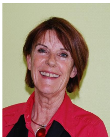
Cécile FORGERON Maire de Mouthiers sur Boème